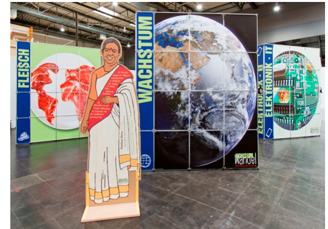
Die Wanderausstellung „KonsumWandel – Wir können auch anders!“

30. Januar und 09. Februar 2015 in Münster